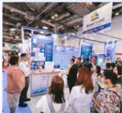
專人導覽 | 強化產品競爭力