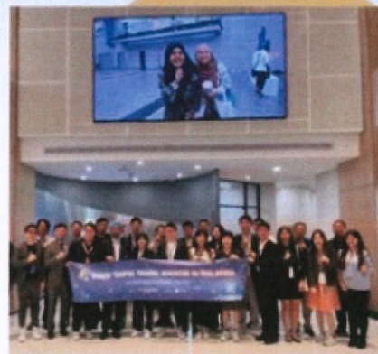
深度參訪 | 掌握市場脈動