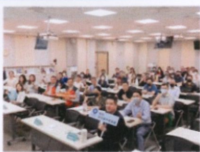
臺灣企業免費參與