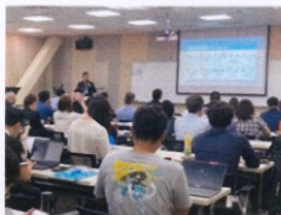
市場商情、趨勢簡報