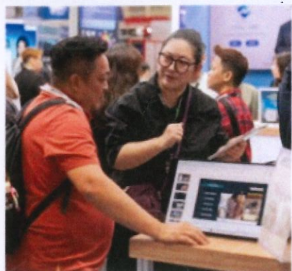
精準媒合 | 對接日本買主